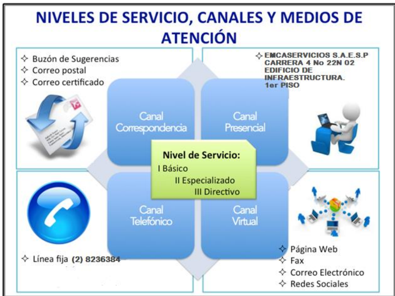
Gráfica 1 – Niveles de Servicio, Canales y Medios de Atención 3

Hace alusión a la atención proporcionada a los temas que estrictamente son de resorte de los Jefes de Oficinas Asesoras y los Subgerentes de la entidad.